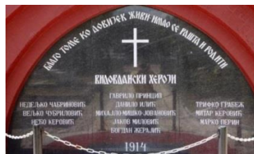
Сви учесници атентата сахрањени су у гробницу Видовданских хероја

Гаврило је живео и у школу ишао у Босни и Хрцеговини. Тамо је био припадник тајне организације Млада Босна која се бавила темама и разматрањима могућности да се народи у „тамници народа“, како су звали Аустро-Угарску, ослободе њихове власти. Због тога су били прогањани, исписивани из школа и младобосанци су волели да дођу у Београд јер је он био слободан град. И Гаврило Принцип је тако дошао у Београд 1912. да би завршио школу, Прву београдску мушку гимназију у улици цара Душана. Завршио је 5. и 6. разред, али је пожелело да учествује у Балканским ратовима где га због младости и ситног раста нису примили. Разочаран 1913. је поново ванредно наставио школовање да би завршио 7. и 8. разред гимназије. Али, престао је да учи кад му је друг из Босне послао тајно и шифровано писмо да ће Босну посетити престолонаследник... Почео је припреме са другим младобосанцима у Београду. Састајали су се често у кафани Златна моруна , шетали по Косанчићевом венцу и Калемегдану и ковали план.